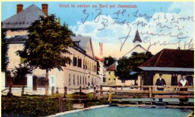
Dom Ruardovih – graščina (levo) na Savi na Jesenicah okoli leta 1900

Sprehod po Stari rudni poti nas popelje v preteklost in nam predstavi detčke iz vsakdana ljudi, ki so kopali in tovorili železovo rudo na tem območju. Si predstavljate, da na svojem pohodu po zgodovinski poti srečate fužinarja, ki ujet v času išče svojega upravitelja, da bi ga povprašal po novih rudnih virih? Ali pa rudarja, ki mu je čas v rudniku ušel in je ves iz sebe, ker je zamudil rudarsko malico? Le kje so njegovi sotrpini?